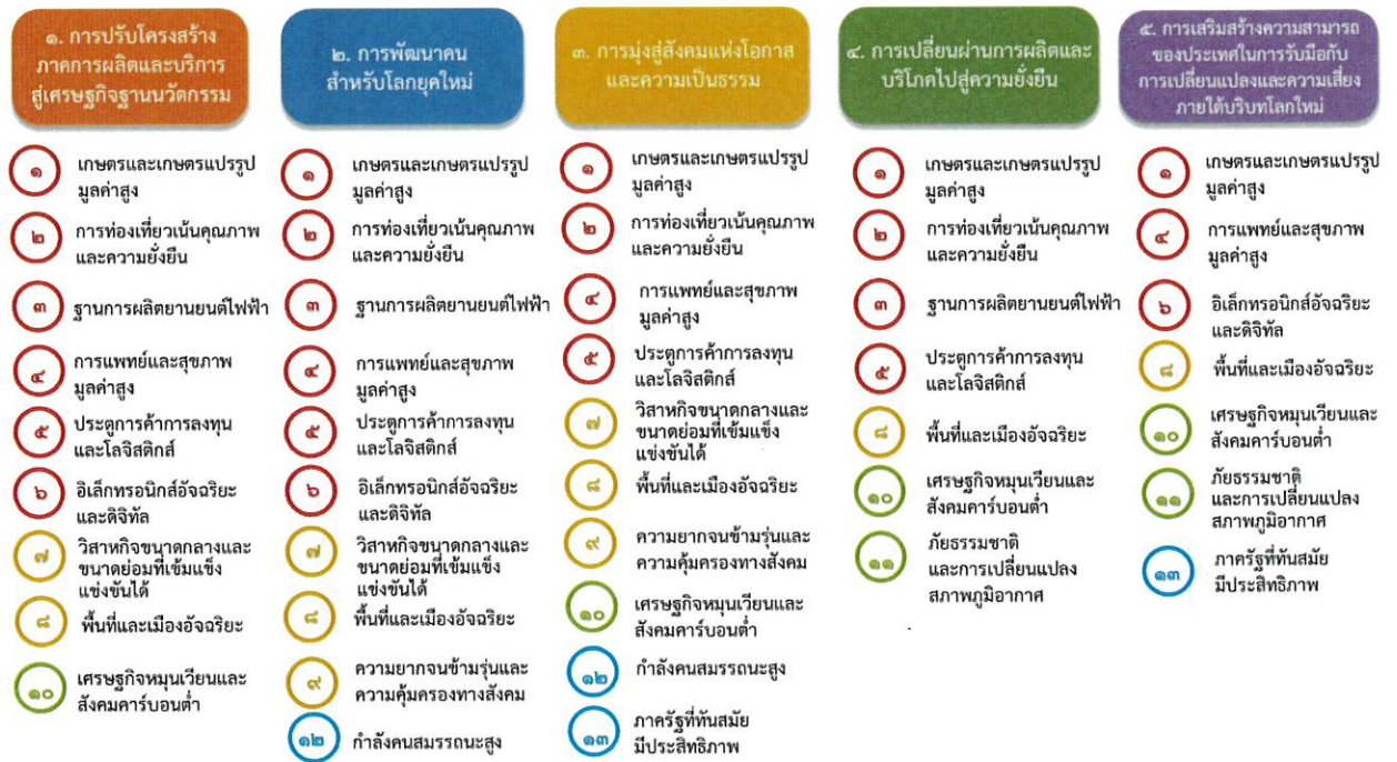
ภาพที่ ๗ การเชื่อมโยงเป้าหมายการพัฒนาที่ยั่งยืนกับแผนแม่บทภายใต้ยุทธศาสตร์ชาติ